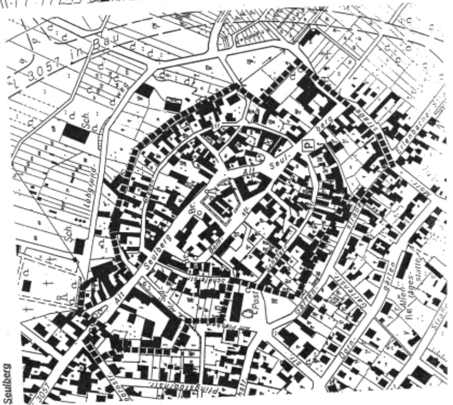
Anlage 2 zur Steinplatz- und Altesatzung der Stadt Friedrichsdorf vom Seite 3